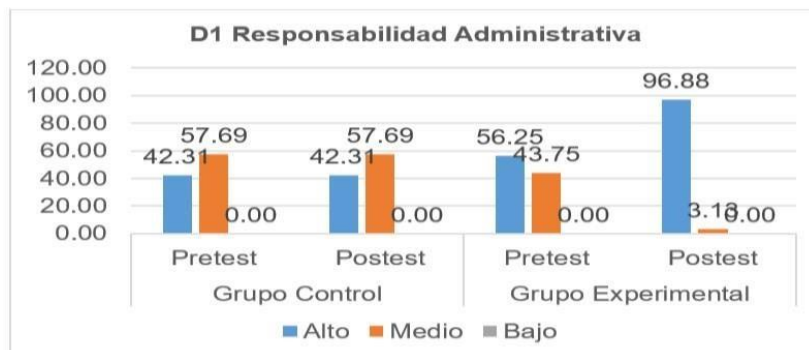
Figura 2. Niveles y porcentajes de la dimensión responsabilidad administrativa

En la figura 2, en el pretest, en ambos grupos predominó el rango alto con 42.31% y 56.25% respectivamente, pero en el postest se demostró los efectos positivos del programa ya que el (GE) logro el rango alto con un 96.88%.