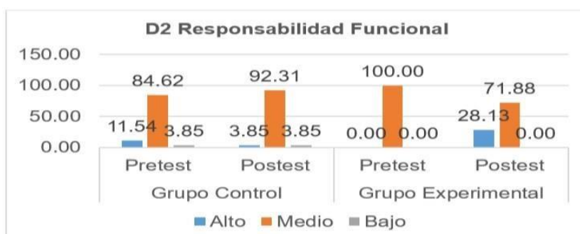
Figura 3. Niveles y porcentajes de la dimensión responsabilidad funcional

En la figura 2, en el pretest, en ambos grupos predominó el rango alto con 42.31% y 56.25% respectivamente, pero en el postest se demostró los efectos positivos del programa ya que el (GE) logro el rango alto con un 96.88%.