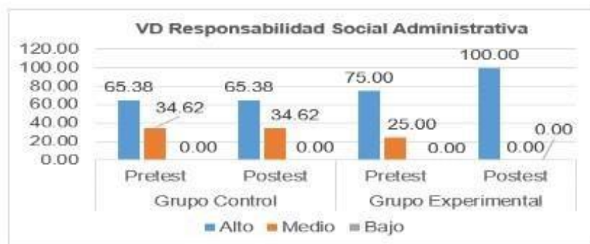
Figura 1. Niveles y porcentajes de la variable Responsabilidad Social administrativa

En la figura 1, en el pretest, en ambos grupos predominó el nivel alto con 65.38% y 75% respectivamente, en el postest el grupo experimental (GE) logro el 100% nivel alto, se puede determinar la existencia de los efectos positivos del programa.