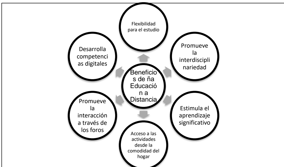
Figura 3. Beneficios de la educación a distancia

La educación a distancia contempla como fortaleza, de acuerdo con Miramontez, A., Castillo, K., y Mecías, H. (2019)