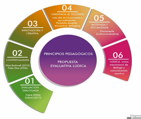
Figura 1. Propuesta Final: principios pedagógicos